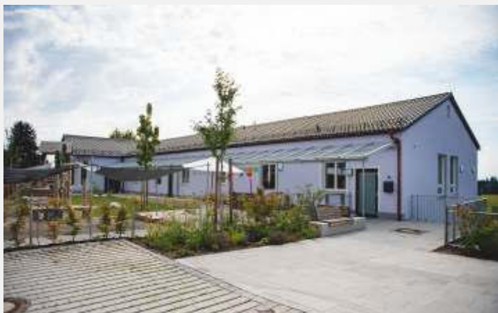
Das sanierte Schulgebäude

Text: Harald Schwarz