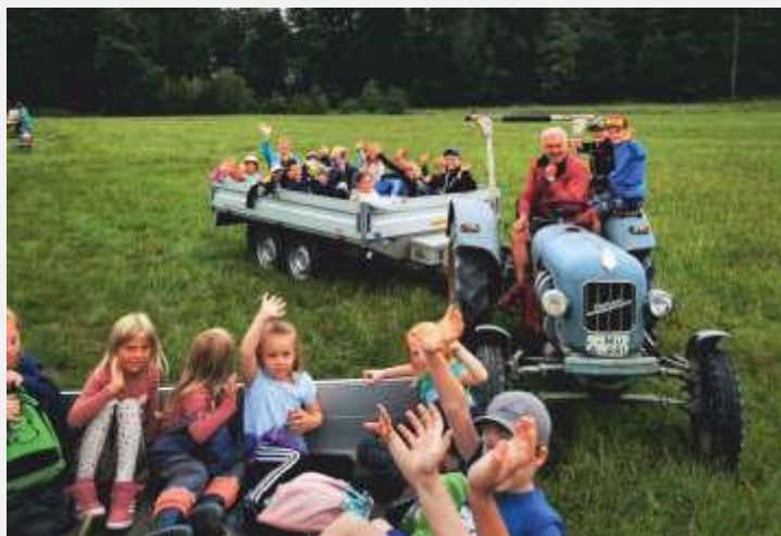
Zum Schluss wurden die Ferienkinder aufgesammelt und mit alten Traktoren und Hängern abgeholt