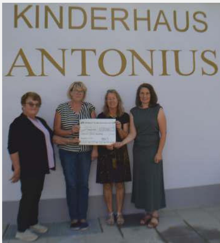
Text und Bild: Carmen Sengmüller