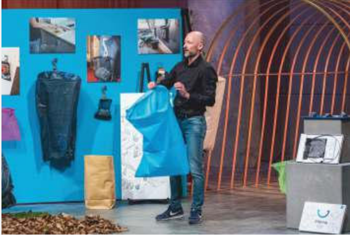
Carsten Maschmeyer (links) macht die Probe aufs Exempel: Er testet das O-Spring-System